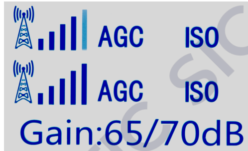
Индикаторы на ЖК-экране

8.1. На передней панели репитера расположен ЖК-экран, на котором отображаются индикаторы уровня сигнала и перегрузки. Все индикаторы работают независимо для каждого диапазона частот. Частотные диапазоны, соответствующие индикаторам, указаны на корпусе репитера слева от ЖК-экрана.