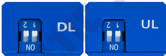
Ручная регулировка усиления. Положение «вверх» — выключено, положение «вниз» — включено

8.3. Дополнительная ручная регулировка осуществляется с помощью переключателей (рычажков), расположенных на торцах репитера.