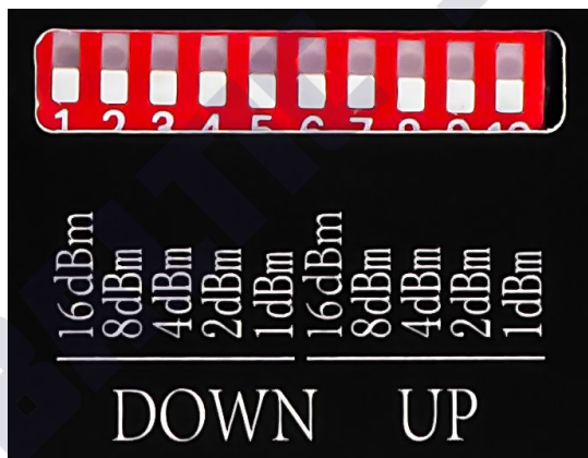
Ручная регулировка усиления. Положение «вверх» — включено, положение «вниз» — выключено

8.4. Дополнительная ручная регулировка осуществляется с помощью переключателей (рычажков) на передней панели репитера.