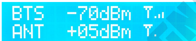
Индикаторы на ЖК-экране

8.1. Репитер оснащен ЖК-экраном, на котором в децибелах указывается уровень входного сигнала до и после усиления ( BTS и ANT соответственно).